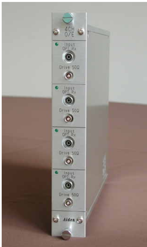
O / E(OP-4200)外觀