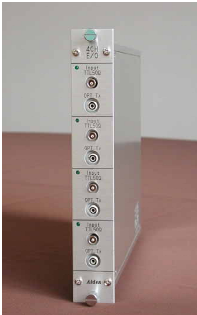
E / O(OP-4100)外觀